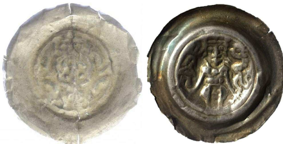
Čechy, Přemysl Otakar II., denár - velký brakteát C.762 a C.770 s vyobrazením dvouocasého lva ve skoku

Z toho, co bylo uvedeno, je zřejmé, že za nejstarší doklady užívání heraldických znamení v prostředí českého knížecího dvora lze považovat už některé výjevy na mincích knížat Soběslava II. a Bedřicha. Jednalo by se o doklady o desetiletí starší než dosud uváděné a patrně bližší reálnému tempu pronikání módních trendů ze západní Evropy na pražský dvůr. Rovněž v otázce užití jednoocasého lva knížaty Soběslavem II., Bedřichem a Přemyslem I. Otakarem i jeho polepšení na dvouocasého, který je dodnes českým znakem, přinášejí mince nezvratná svědectví, jejichž dosavadní interpretace by možná stály za zvýšenou pozornost současných historiků-heraldiků.