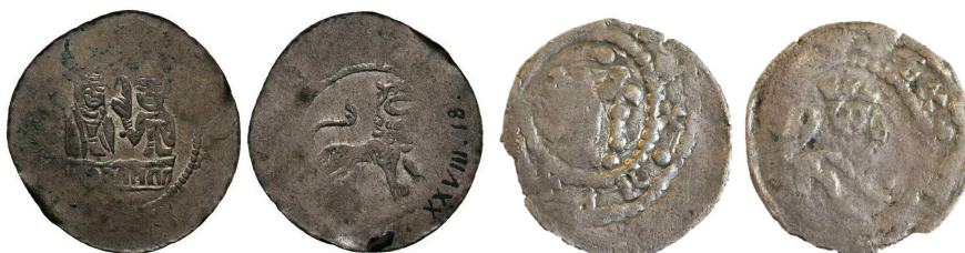
Čechy, Přemysl I., denár C.668 a Čechy, Přemysl I. společně s Václavem I., Stará Plzeň, denár C.701 s vyobrazením jednoocasého lva zprava (ve druhém případě korunovaného!)

Polepšení českého lva o druhý ocas není prokazatelně časově zařazené. Takřčený Dalimil píše o udělení druhého ocasu českému lvu Přemysla Otakara I. římským králem Otou IV. za pomoc s potlačením saské vzpoury, ale historici a heraldikové to považují za kronikářovu smyšlenku s odůvodněním, že Přemysl I. nikdy lva jako heraldické zvíře nepoužíval. Jsou tu ale znovu mince, které dokládají opak - na denáru C.668 je opět vzorně, byť tentokrát z pravé strany, vyobrazený důstojně stojící jednoocasý lev; na plzeňském denáru C.701 (společně ražbě Přemysla I. se synem Václavem z let 1228-1230) jde již nadevší pochybnost o heraldickou figuru, neboť jednoocasý lev zprava na rubu mince je korunovaný! Faktem zůstává, že bezesporu nejstarší zobrazení dvouocasého lva jako heraldické figury na mincích je známé až z velkých brakteátů Přemysla Otakara II. - typů C.762, 769 a 770.