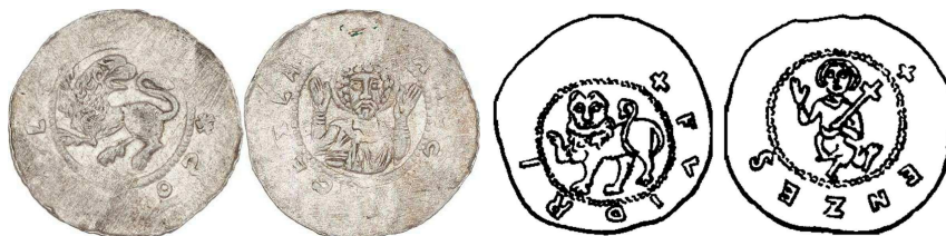
Čechy, Soběslav II., denár C.618 a Čechy, Bedřich, denár C.632 s vyobrazením jednoocasého lva zleva

Jsou to denáry C.618 knížete Soběslava II. a C.632 knížete Bedřicha, které dle mého názoru lze považovat za nejstarší vyobrazení českého lva, ještě jednoocasého, jako zemského znaku.