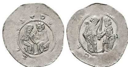
Čechy, Soběslav II., denár C.620 - na štítu v Rv. orlice(?)

Podle Cachovy typologie českých denárů existuje jediný denár Bedřicha, na kterém je zobrazená orlice. Jde o typ C.636 datovaný do 2. Bedřichovy vlády v letech 1179-1181. Na minci je orlice v celém obrazovém poli a kolem ní rovnoramenné křížky. Řekl bych, že náznaky heraldických vyobrazení orlice na štítu lze pozorovat už na denáru C.620 - tedy na minci Soběslava II. z let 1173-1179. Zde v rubní scéně žehná biskup knížeti, který drží v pravici pozdvížený meč a levou rukou přidržuje na zem postavený štít. A právě na tomto štítu lze s trochou fantazie zahlédnout vyobrazenou orlici:-)