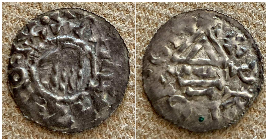
Čechy, Boleslav I., Praha, denár typ široká ruka - kaplice s VVI

Získat jakýkoliv denár z desátého století je vždy mimořádnou, takřka sváteční událostí, která ve sběrateli podněcuje touhu po dalších informacích o historickém období, o knížeti nebo mincovně, jejichž jména jsou na minci uvedena, nebo o minci samotné a jejích osudech. Historické údaje jsou dostupné z mnoha zpracování, avšak k době desátého století mnoho pramenů historičtí badatelé zrovna nemají a tak jsou líčení té doby poměrně stručná. O to zajímavějším a cennějším se stává každý střípek mozaiky, ze které se historie skládá.