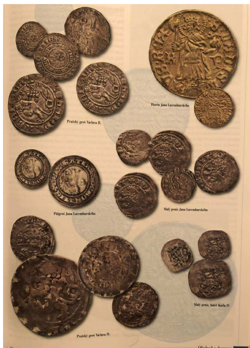
s. 91 se spoustou bot:-)

Před pár dny jsem náhodou navštívil knihkupectví a zašel k policím s nápisem HISTORIE. Moji pozornost upoutala poměrně útlá kniha velkého formátu Vlastimila Vondrušky: Život ve staletích - 14. STOLETÍ - lexikon historie. Knihou jsem letmo zalistoval, očima proletěl obsah a vzhledem k logické struktuře obsahu i výpravnosti, ale především s ohledem na moje zvláště oblíbené 14. století, jsem knihu zakoupil. Nemilé překvapení mě čekalo doma, když jsem při podrobnějším listování narazil, téměř ke konci knihy, na kapitolu Obchod a doprava.